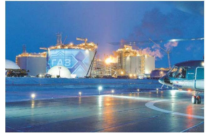
Строительство завода СПГ комплекса ЯМАЛ СПГ (трех технологических линий)