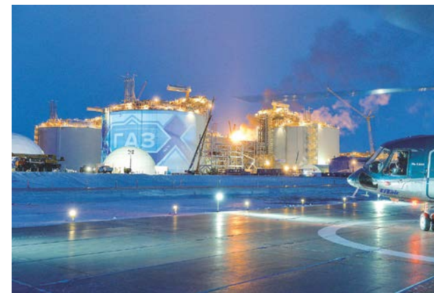
Строительство завода СПГ комплекса ЯМАЛ СПГ (трех технологических линий)